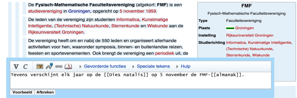
FIGUUR 2 De interface met blauwe balkjes om een zin, paragraaf of sectie te bewerken. De langwerpige, meest linkse blauwe balk is voor het bewerken van de hele pagina. Aan de rechterkant van de pagina zie je het resultaat van het informatievak dat in figuur 1 te zien is.

waardoor het mogelijk blijft de tekst te bewerken, het hoogste niveau is immers de gehele pagina en die kan nergens mee conflicteren. Bovendien conflicteren niveaus zoals secties en paragrafen maar zelden. Omdat de gebruiker de wikitekst uiteindelijk toch moet bewerken, kan die net zo goed soms iets langer en complexer zijn. Dat is bij een traditionele visuele editor niet mogelijk.